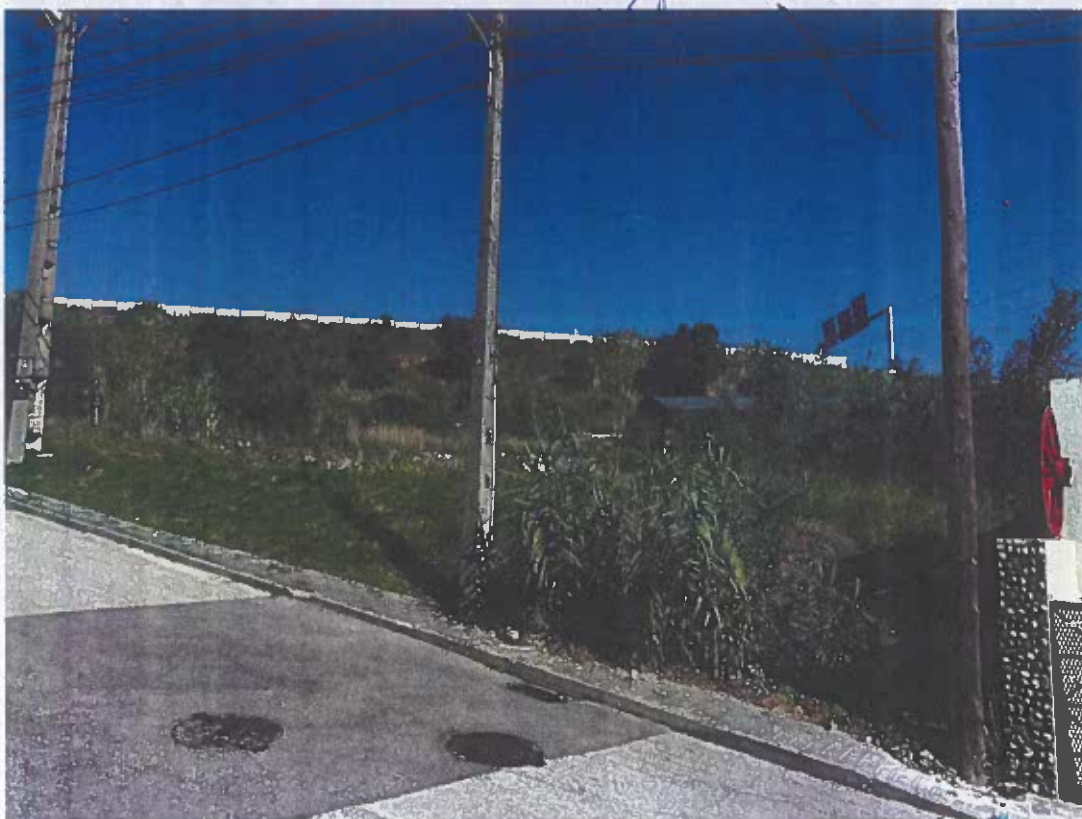
Vista Lateral Direita e Frontal do Lote 75