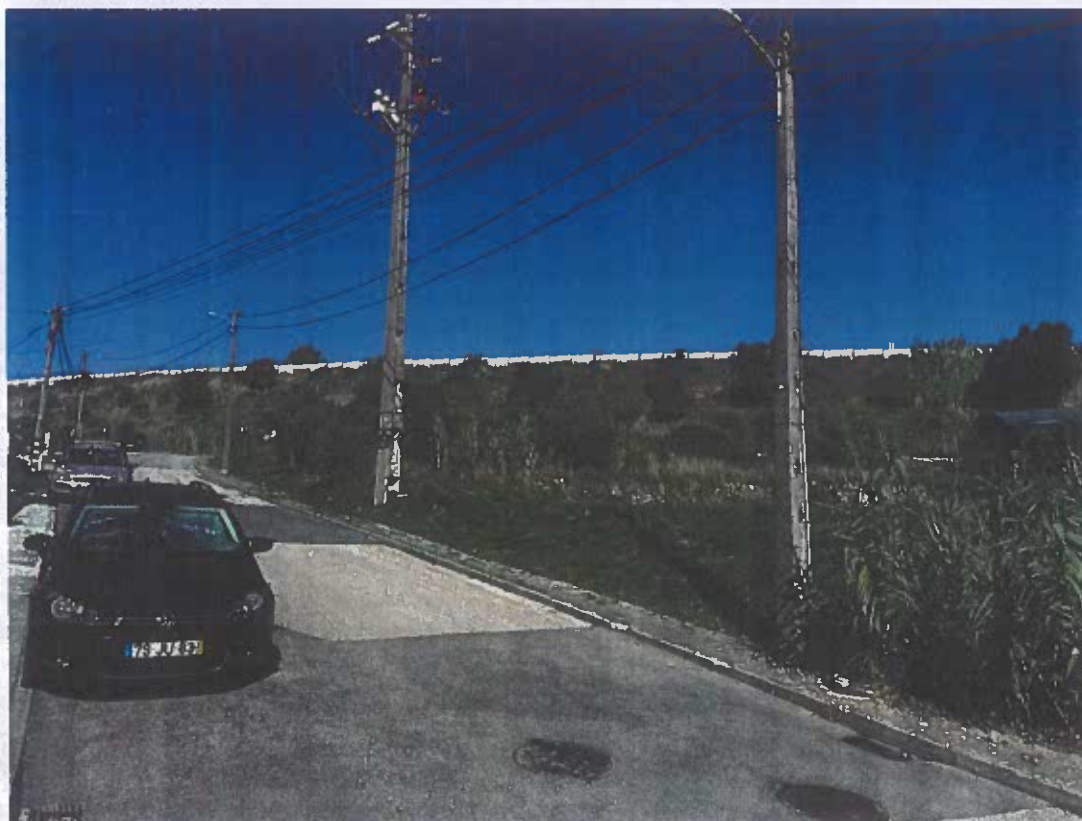
Acesso Rua B (Rua do Rio Seco) ao Lote 75 – Vista Norte