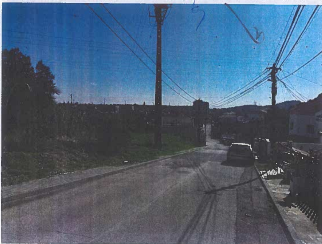
Acesso Rua B (Rua do Rio Seco) ao Lote 75 – Vista Sul