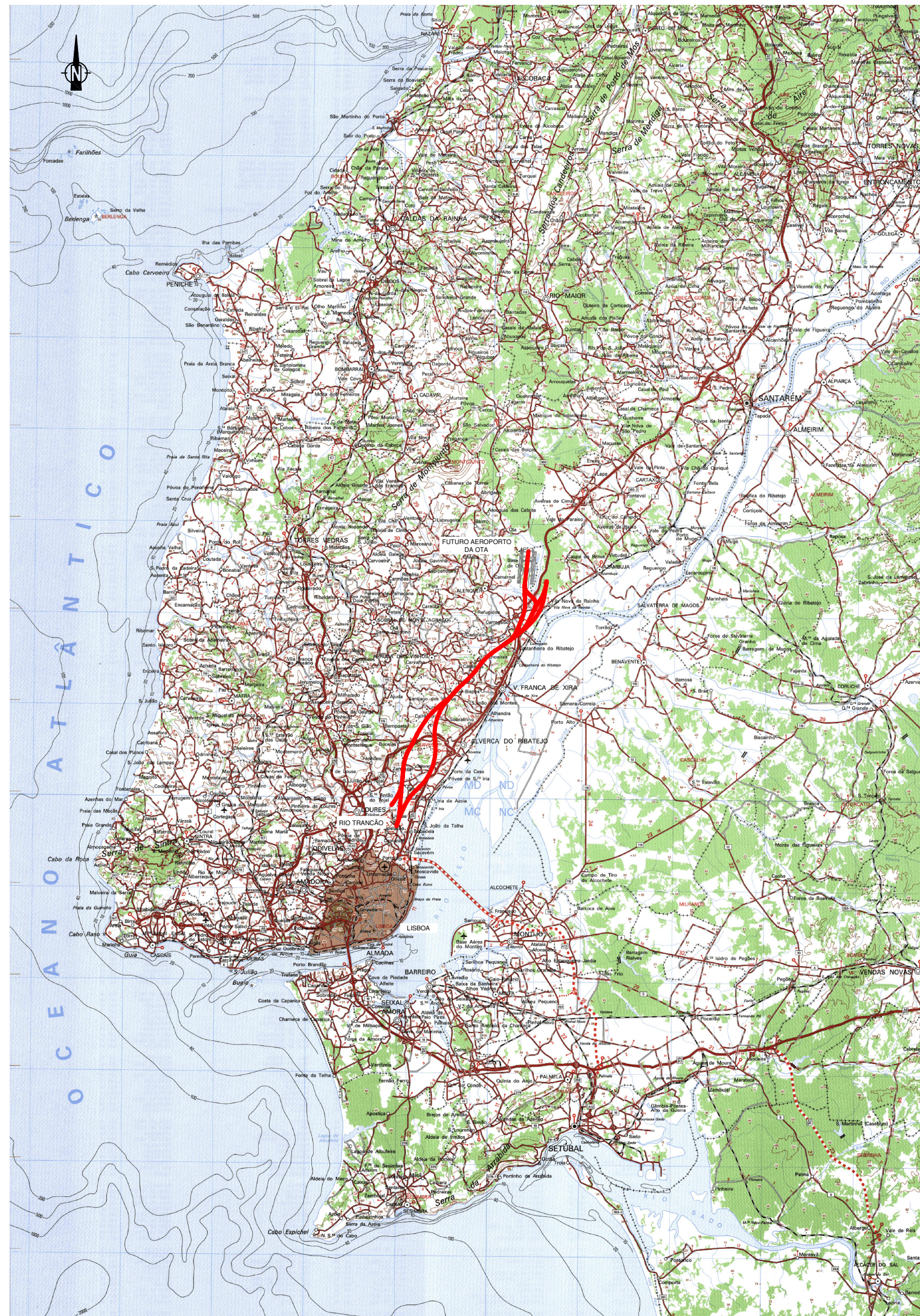
Planta Localização Escala 1:250 000