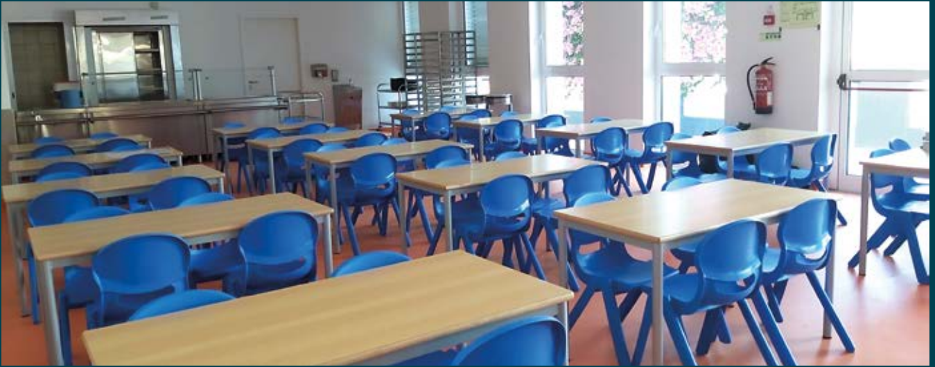
Escola Básica n.º 2 de Alhandra