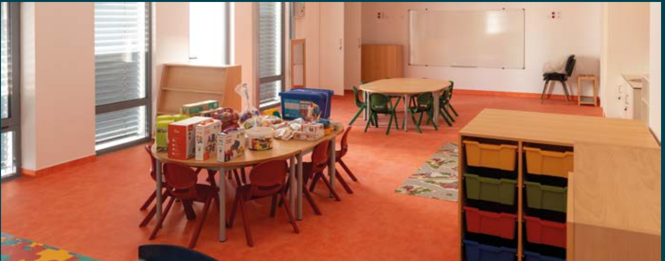
Escola Básica do Cabo de Vialonga

conforto dos alunos, nomeadamente durante os intervalos letivos. Por seu lado, a Escola Básica n.º 2 de Alhandra alocou um montante total de 1,6 milhões de euros (620 mil euros provenientes do FEDER da UE e 980 mil euros foram da responsabilidade do Orçamento Municipal), o que permitiu a remodelação geral da construção existente e a criação de um novo edifício de dois pisos, numa área total de cerca de 1.200 m 2 .