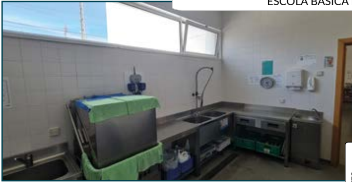
ESCOLA BÁSICA DA QUINTA DA VALA