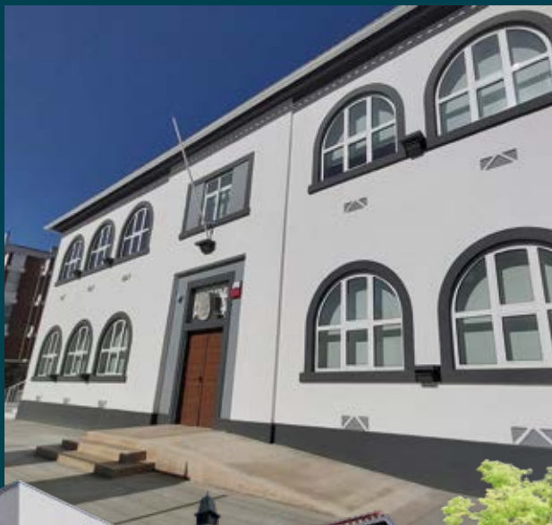
Escola Básica do Cabo de Vialonga