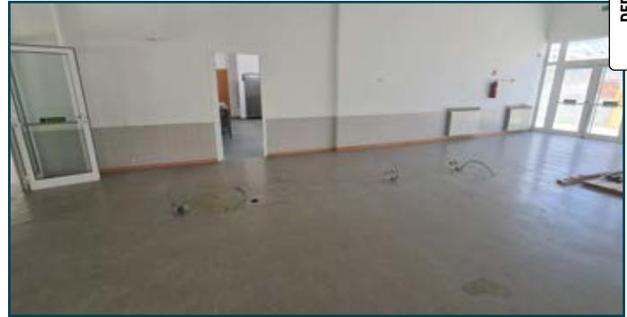
ESCOLA BÁSICA 2, 3 ARISTIDES DE SOUSA MENDES